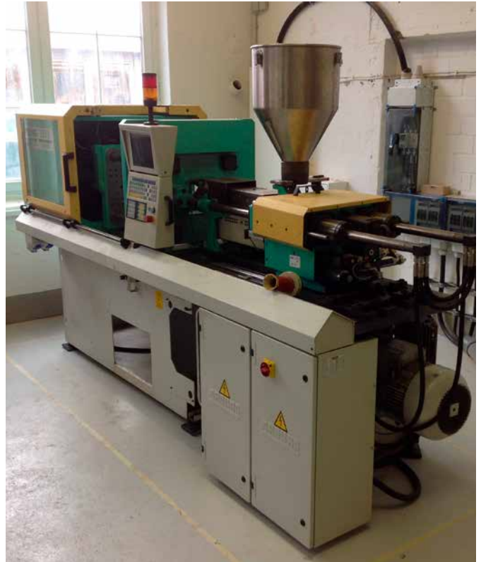
Eine der drei gekühlten Spritzgießmaschinen im Testlabor von PolymerEngineering

Im ersten Schritt ging es um die Wasserkühlung von drei Spritzgießmaschinen. Trotz unterschiedlicher Voraussetzungen sollten alle drei Maschinen mit nur einem Gerät gekühlt werden. Doch bevor die passende Rückkühlanlage bestimmt werden konnte, analysierten die Experten von Pfannenberg die örtlichen Gegebenheiten und berechneten den tatsächlichen Kühlbedarf sowie die erforderliche Vorlauftemperatur. Denn nur, wenn die Leistung der Rückkühlanlage optimal auf die Anwendung abgestimmt ist, kann ein störungsfreier Betrieb gewährleistet werden. Ansonsten drohen bei Überdimensionierung der Kühlanlage erhöhte Stromkosten und eine verringerte Lebensdauer des Rückkühlers und bei Underdimensionierung kostenspielige Ausfälle oder Stillstände der Spritzgießanlage.