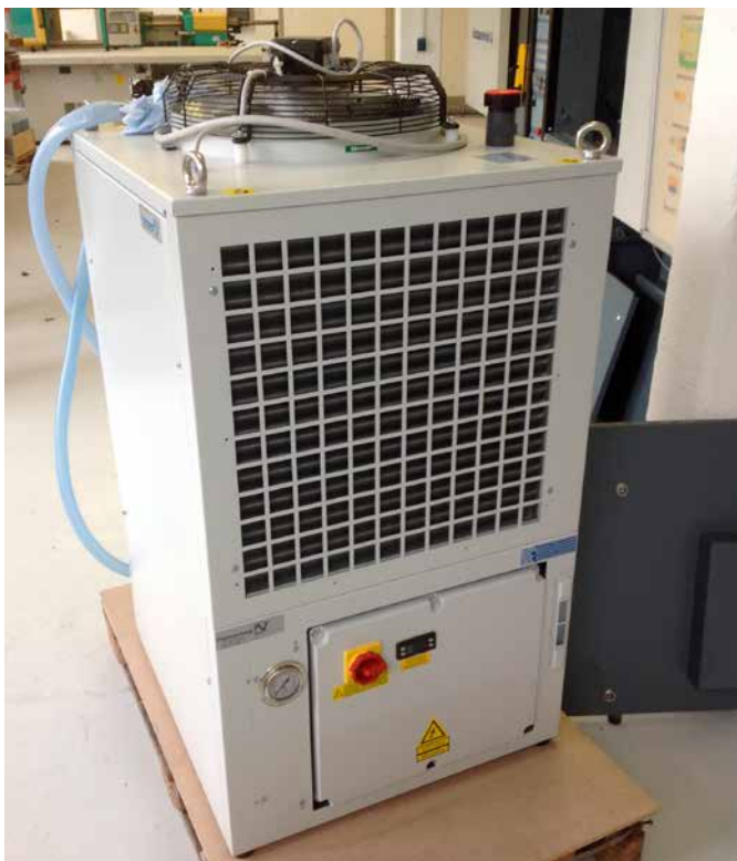
Eine Rückkühlanlage des Typs EB 130 WT CE STD kühlt den Spritzgießprozess von drei Spritzgießmaschinen